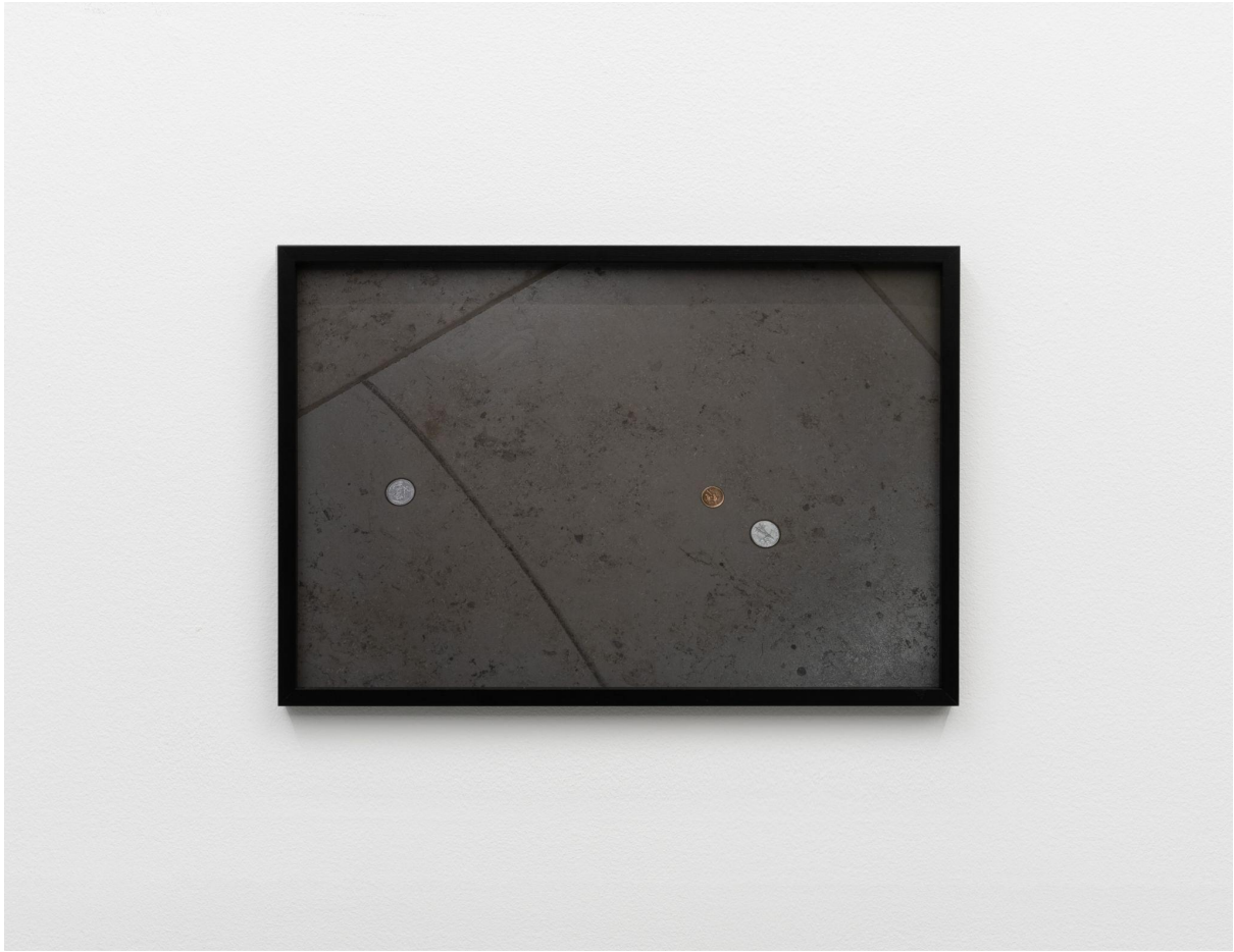
Coin #3 2023 Archival pigment print 30 x 45 cm Unikum