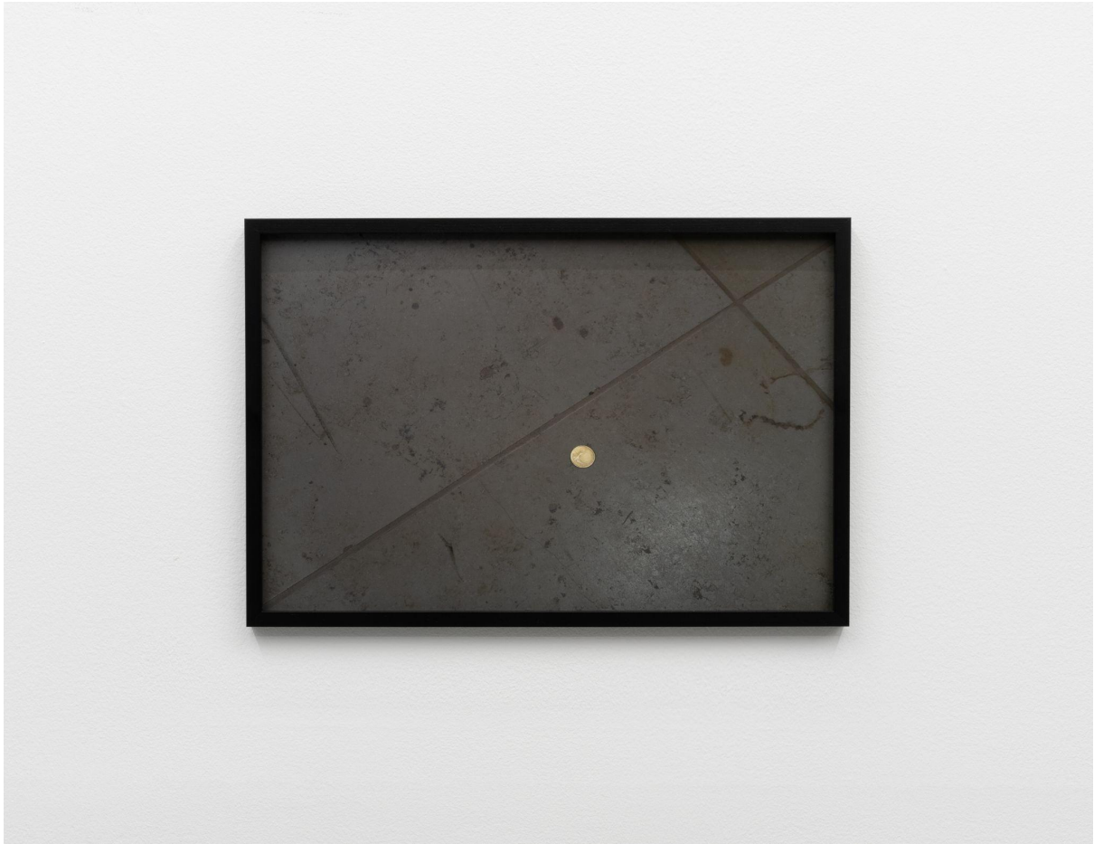
Coin #1 2023 Archival pigment print 30 x 45 cm Unikum