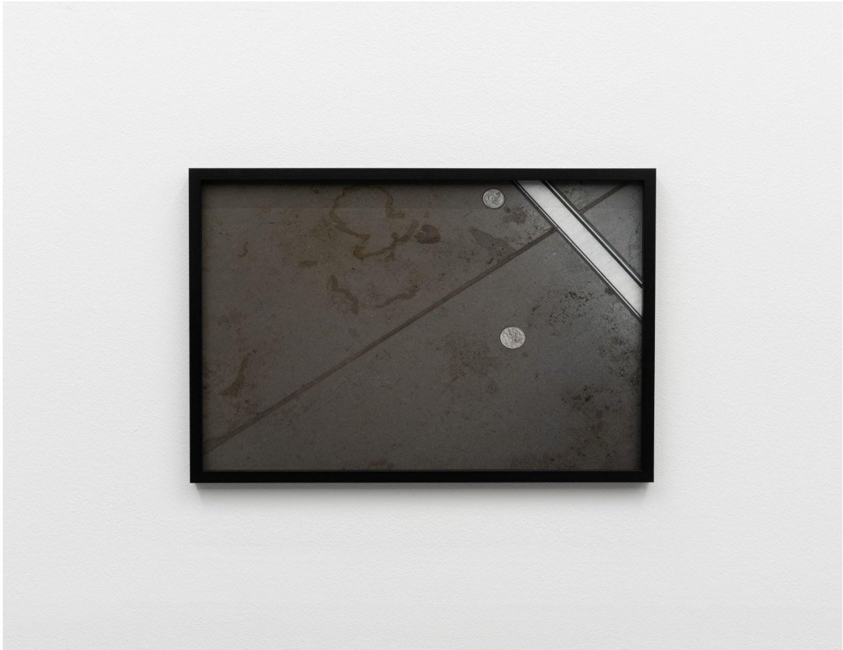
Coin #2 2023 Archival pigment print 30 x 45 cm Unikum